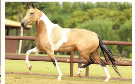
SUA MÃE CARIOCA DA SANTA ESMERALDA