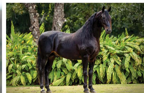
SEU PAI FABERGÉ CAPIM FINO