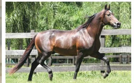
SEU AVÔ CABUÇU DA SELVA MORENA