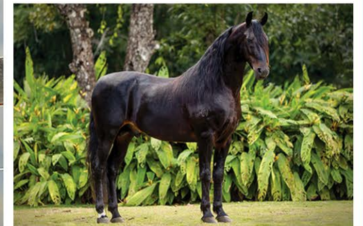
SEU PAI FABERGÉ CAPIM FINO