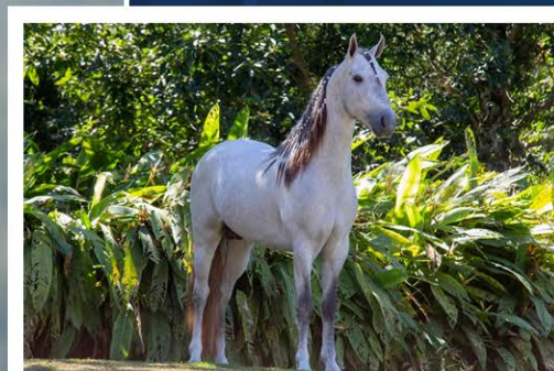
SEU PAI BRUTUS ELFAR