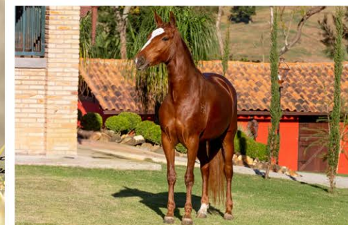
SUA MÃE ALEGRIA ALTER