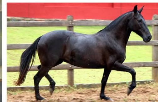
SUA MÃE CABANGU GRAÚNA