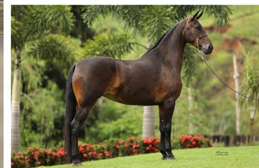
SUA MÃE ALTEZA ALTER