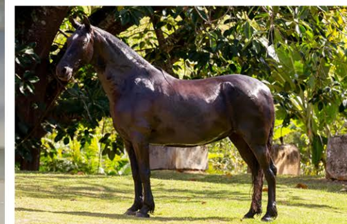
SUA MÃE SARDELHA FORUM