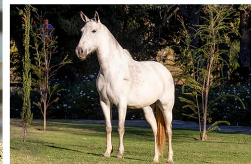
SUA MÃE IMPERATRIZ ITAOCA