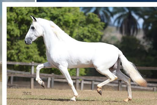
SEU PAI SINO DO YURI