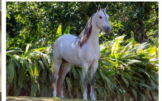
SEU PAI BRUTUS ELFAR