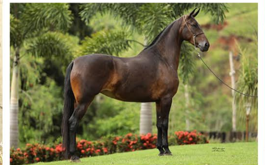
SUA MÃE ALTEZA ALTER