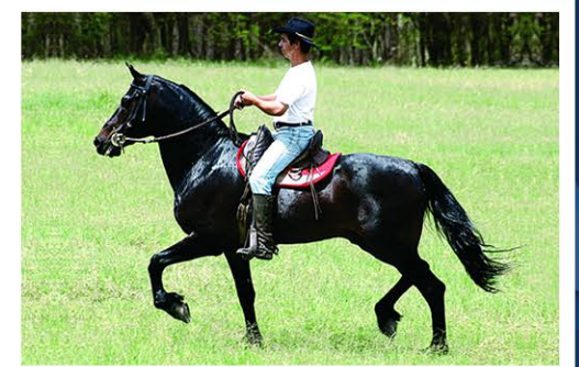
SEU AVÔ MULATO D2