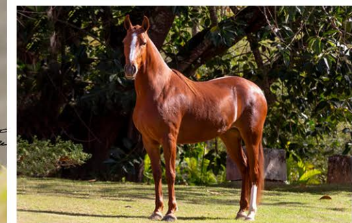
SUA MÃE BENDITA ALTER