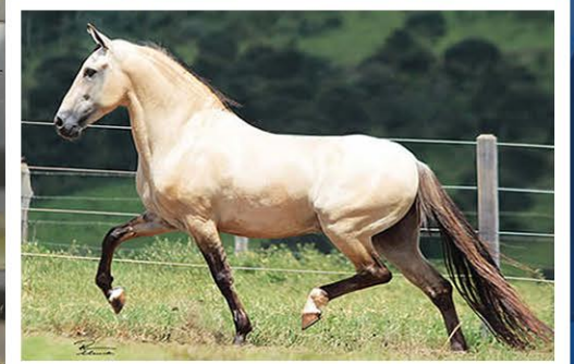
SEU AVÔ FAVACHO ESTANHO