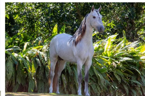
SEU PAI BRUTUS ELFAR