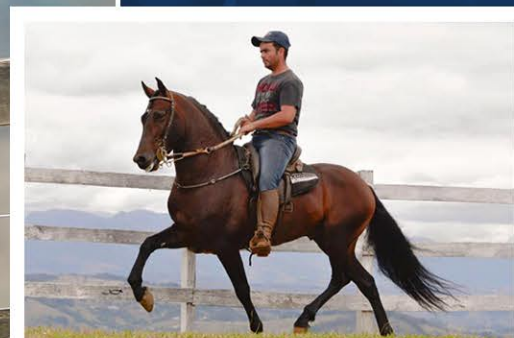
SEU PAI MODELO DO SALTO