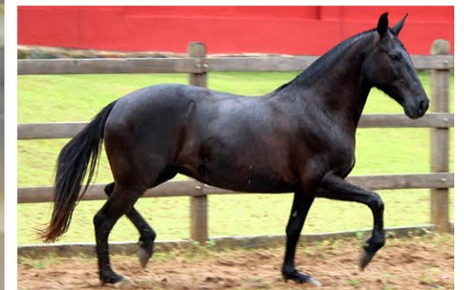
SUA MÃE CABANGU GRAÚNA