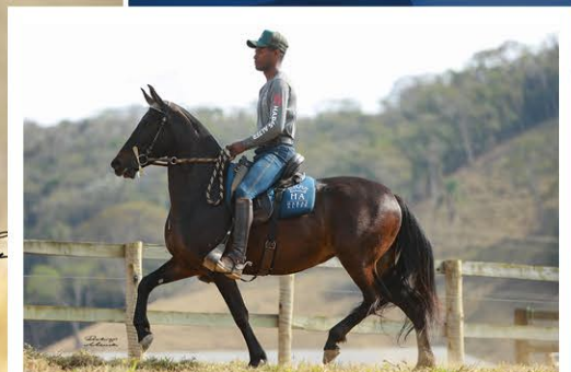
SUA MÃE CHARLOTE ALTER