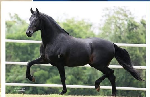
SEU AVÔ ORIGINAL DO PASSO FINO